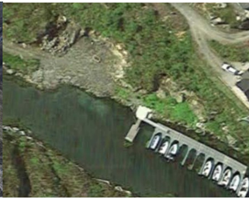
Planlagt naustområde vert på planert område over