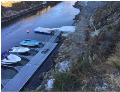
Foto av småbåtanlegg