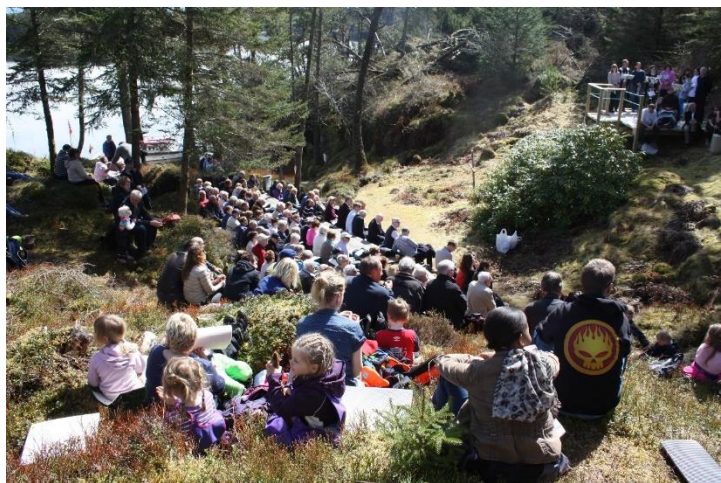
Bilete: Frå fredsmarkering på Selsøy. 9. klasse les dikt.

I tillegg vert det produsert tilbod i Nordhordland og lokale tilbod i Austrheim.