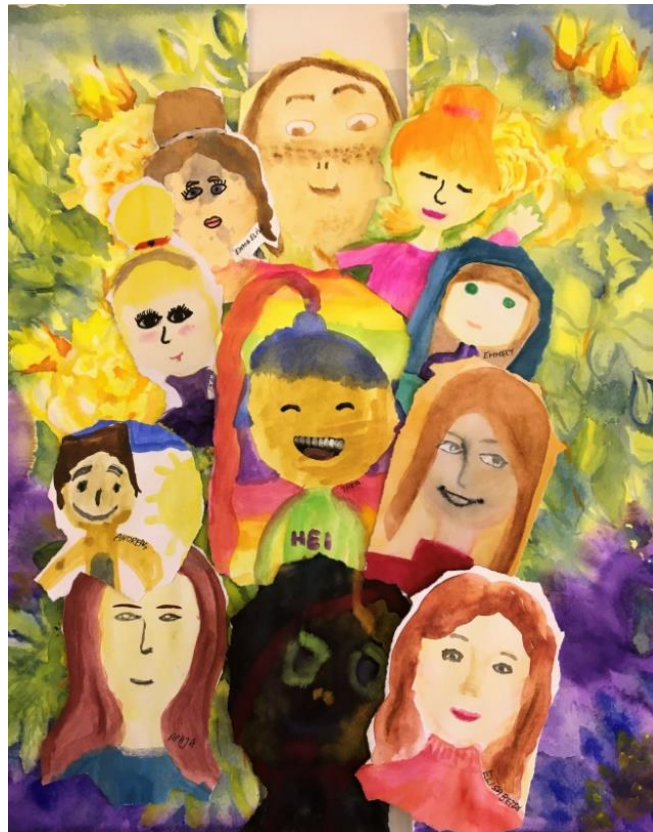
Bilete: frå DKS-kunstprosjekt med 6.klasse på Kunsthuset Austrheim